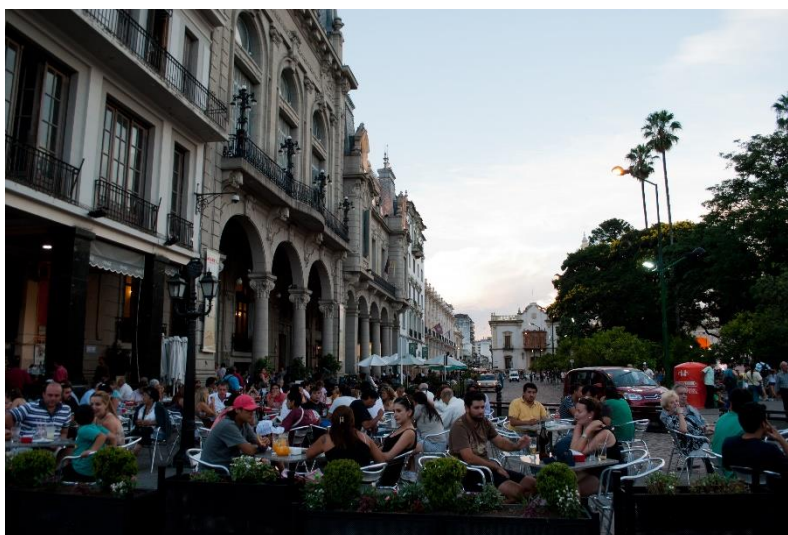
Het gezellige centrale plein in Salta

Inbegrepen: Stadstour (incl. entree museum) en hotelovernachting