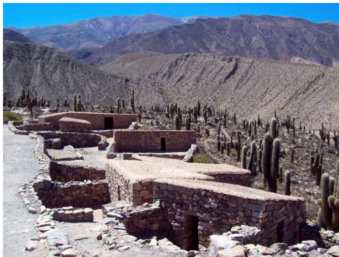
Pucar de Tilcara

Het volgende hoogtepunt is Tilcara, een van de levendigste quebrada-dorpen. Het dorp wordt voornamelijk gedomineerd door de indrukwekkende bergen eromheen en het belangrijkste hoogtepunt is het Incaopenluchtmuseum, de Pucar de Tilcara. Dit fort op de heuveltop, op 1 km van het dorp, stond hier al vijf eeuwen voor de komst van de Inca's. Vanuit het fort heeft u een mooi uitzicht op de quebrada.