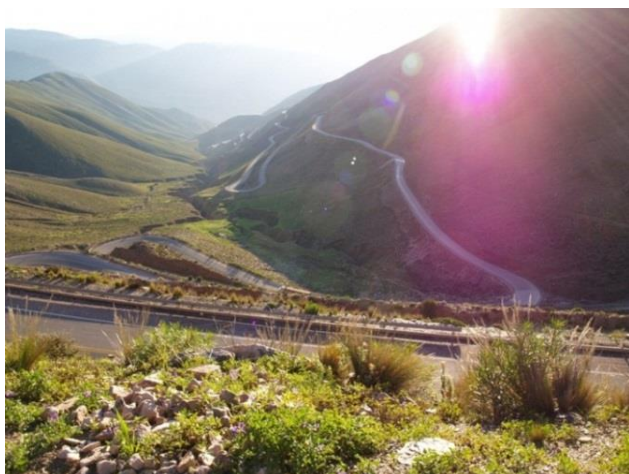
De route naar de zoutvlakte is van een ongekende schoonheid

Totale rijafstand en duur: 340 km - 6 tot 8 uur