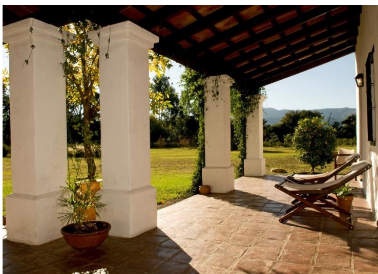
In Finca Valentina komt u heerlijk tot rust

Hotel comfort: Finca Valentina | Inbegrepen: ontbijt Inbegrepen: Hotelovernachting