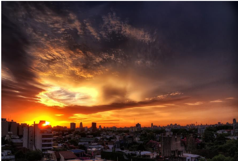
Zonsondergang in Buenos Aires

Hotel comfort: Casa Sur Recoleta | Inbegrepen: ontbijt Inbegrepen: Hotelovernachting