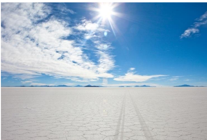
De immense zoutvlakte van Salinas Grandes