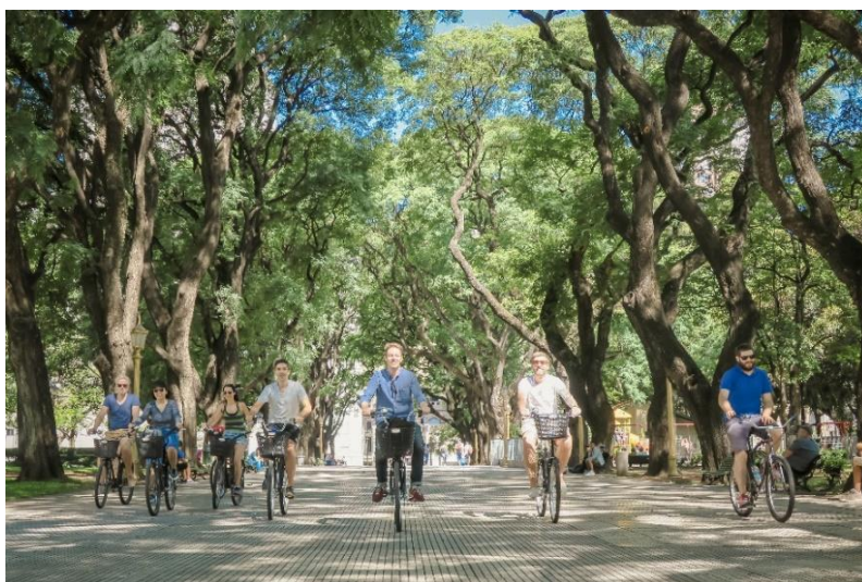
Een van de vele prachtige stadsparken in Buenos Aires

Tijdens de fietstour die om 10:30 uur begint en ongeveer 3,5 uur duurt, maakt u kennis met een groot aantal historische, sociale en architectonische hoogtepunten. U doet onder andere het Plaza San Martín (een van de mooiste pleinen van Buenos Aires bekend om de fraaie gebouwen), Plaza de Mayo (het plein van de Dwaze Moeders), Teatro Colón (het voornaamste muziektheater van de stad gelegen aan Avenida 9 de Julio), Mercado de Abasto (het mooiste winkelcentrum van de stad gebouwd in 1895), Pasaje Carlos Gardel en Cementerio de Recoleta (beroemde begraafplaats met het graf van Evita Perón) aan.