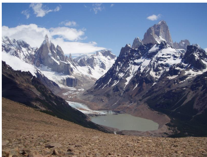
Het ongerepte Parque Nacional los Glaciares

Inbegrepen: Huurauto en hotelovernachtingen