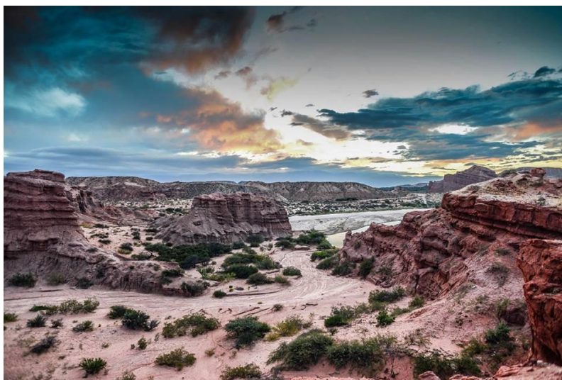
De route van Cachi naar Cafayate kenmerkt zich door werkelijk prachtige vergezichten

Totale rijafstand en duur: 113 km - 2,5 uur