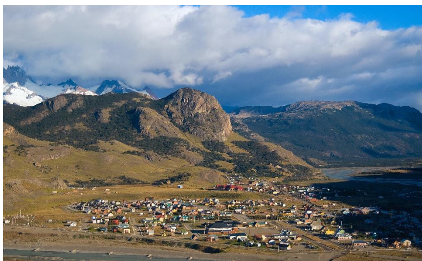
Het trekkersdorp El Chaltén

Vandaag volgt u de provinciale weg 11 en de bekende Ruta 40. U rijdt parallel aan de rivier La Leona tot het moment dat u uitkomt bij hotel La Leona. Hier ontmoet u uw gids die u het versteende bos laat zien. Het bos stamt uit de Jura, 150 miljoen jaar geleden, toen de Andes nog niet bestond en er continu vochtige winden uit de Grote Oceaan waaiden, die voortdurend regen meevoerden wat de groei van tropische bossen bevorderde. Toen de Andes werd gevormd, begroef vulkanische activiteit deze bossen onder vulkanische as. Het landschap is bezaaid met gefossiliseerde bomen, versteend op de plek waar ze oorspronkelijk groeiden. Er bloeien in het voorjaar en in de zomer prachtige bloemen. In de middag rijdt u naar El Chaltén.