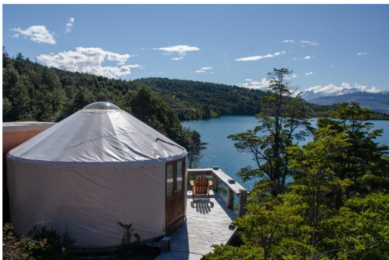
Het prachtig gelegen Patagonia Camp

Inbegrepen: Transfer hotel/busterminal/hotel, busreis en hotelovernachting