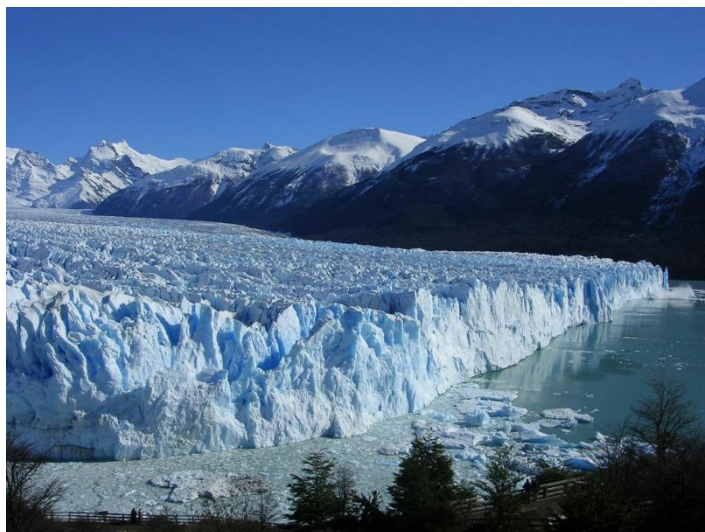
De immense Perito Moreno gletsjer

Vandaag brengt u een bezoek aan de Perito Moreno gletsjer. De gletsjer is met zijn lengte van 31 km en zijn breedte van 4 km zeer spectaculair. Het ijs 'stroomt' van de cordillera (bergketen) naar het melkachtige Lago Argentino, het grootste meer van Argentinië.