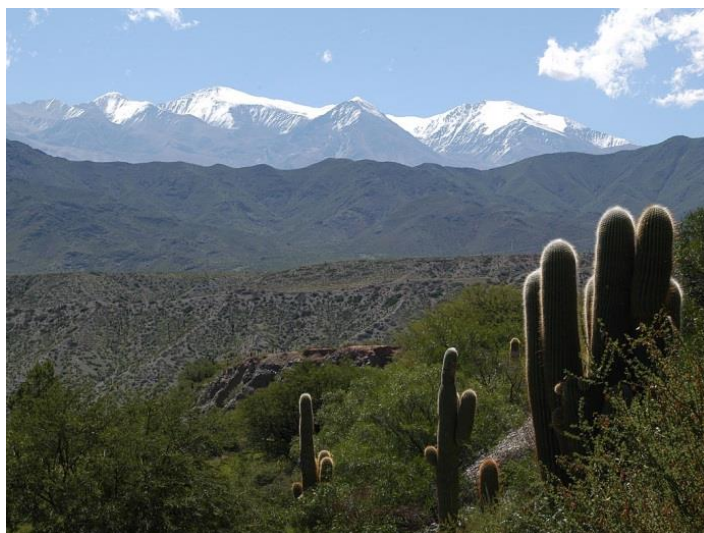
Parque Nacional Cardones, het park van de zuilcactussen

Enmaal op de Ruta 33 verandert het landschap in kalere bergen met rodegesteentes en cactussen. U rijdt via een slingerweg omhoog naar het plateau Cuesta del Obispo. Het uitzicht vanaf de top is werkelijk fenomenaal. U vervolgt uw weg door het Los Cardones Nationaal Park. Het landschap verandert weer. Het groen van zojuist heeft plaatsgemaakt voor een steenachtige omgeving met het besneeuwde Andesgebergte op de achtergrond.