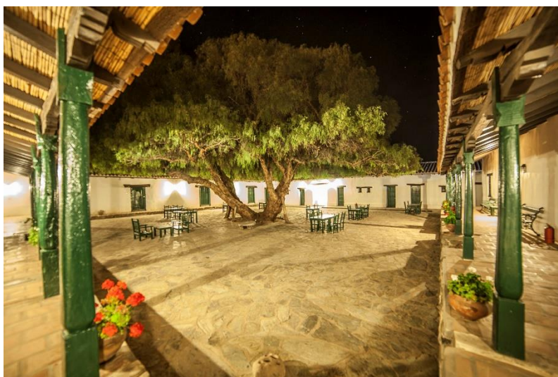
Om 12:30 uur schuift aan voor een heerlijke lunch bij Hacienda Molinos

We hebben om 12:30 uur voor u een tafel gereserveerd voor de lunch (niet inbegrepen) bij de 18 e eeuwse Hacienda Molinos, een van de oudste wijngaarden van Argentinië. De hacienda is in koloniale stijl gebouwd en ligt nabij het gelijknamige plaatsje. U heeft er prachtig uitzicht op het omliggende berglandschap.