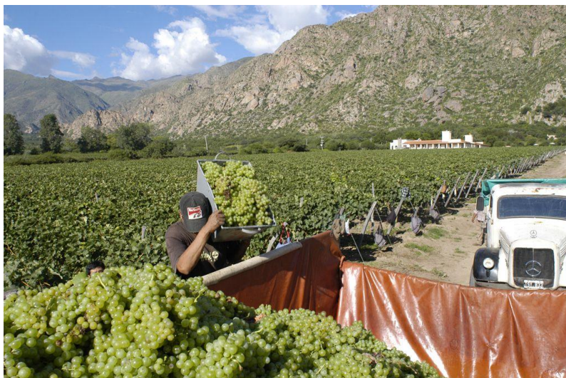
De vele wijngaarden waarmee Cafayate wordt omgeven

Inbegrepen: Huur auto en hotelovernachting